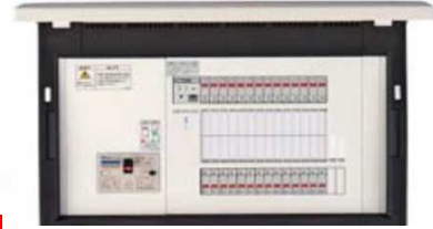
感震ブレーカー(分電盤)