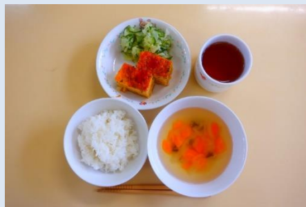
ごはん スパニッシュオムレツ グリーンサラダ 人参スープ