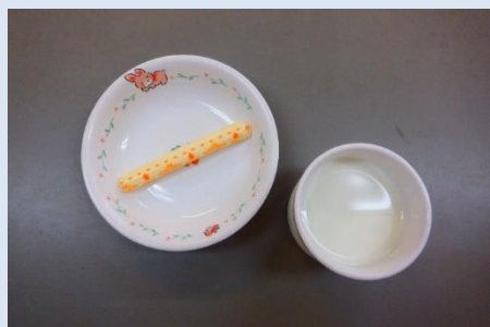
牛乳 プロセスチーズ