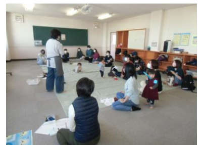
子どもの足育講座