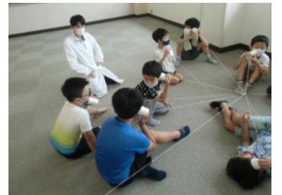
科学あそびを楽しもう！