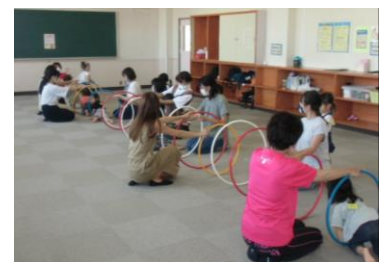
親子で楽しくリズムあそび