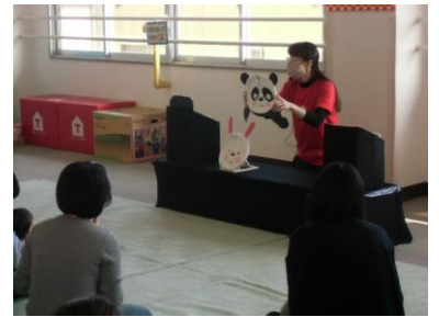
紙皿シアターを楽しもう！

職員は、子どもたちが自分のやりたいことを見つけ、自分のペースでやり遂げられるように手助けをしたり、友だちと相談してあそびを進めるなどができるように支援をしています。