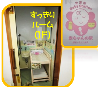
すっきり ルーム (1F)