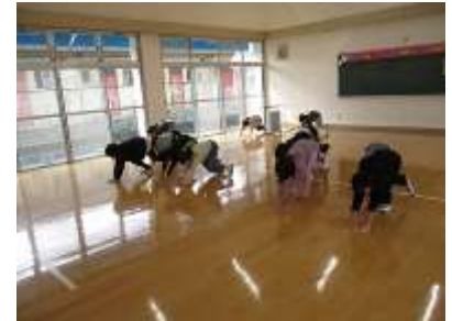
『ビューティフルデー ～館内の清掃～』