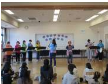
『つくしっ子まつり ～親子コンサート～』