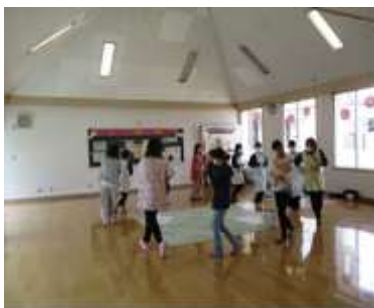
ふれあいひろば 「ふれあいタイム」