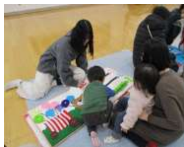
ともだちひろば 「手作り絵本を通して 高校生と触れ合おう♪」