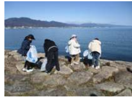
キッズボランティアじゃれきんぐ！ 「奉仕活動～なぎさ公園～」

＜内容＞児童館や地域内での様々なボランティア活動 清掃活動、児童館のまつりのスタッフ 保育園児・高齢者との交流 など