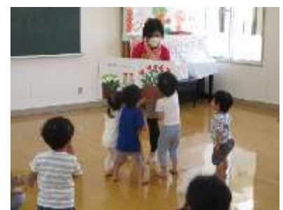
えくぼひろば 「おはなしタイム」