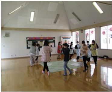
ふれあいひろば 「ふれあいタイム」