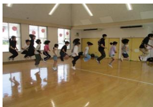
小学生運動あそび 「ダブルダッチ」