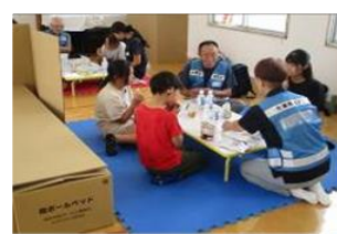
「防災学習：避難所体験」