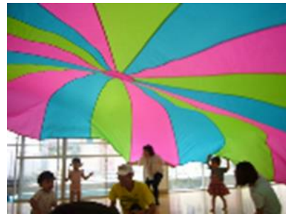
ともだちひろば 「バルーン」