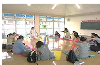
子育て講座 『親子ふれあいあそび & ベビーマージ』