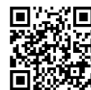
救急車利用マニュアル