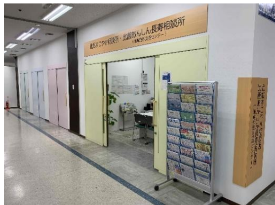
すこやか相談所入り口