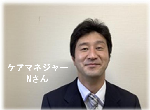
ケアマネジャー Nさん