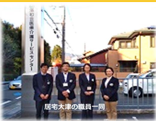
居宅大津の職員一同