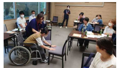
匠に聞く：介護職員との交流会

介護に関する知識や介護の業務に携わる上で知っておくべき基本的な技術を学ぶ研修を開催するとともに、介護職員との交流や、施設等の見学・体験の機会により、介護現場での就業等につなげる。