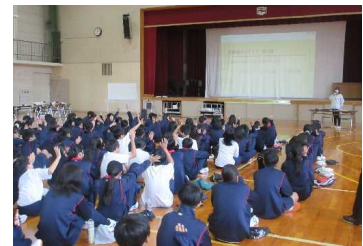
講義の様子（南郷中学校）