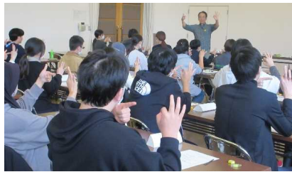
令和7年度フォローアップ研修