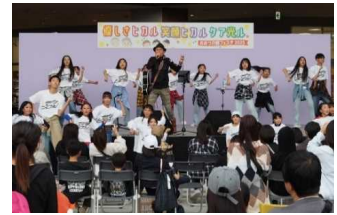
介護フェスタ2025の様子

介護及び介護職に対する関心が高められるよう、広く市民に魅力や情報を発信する場として「おおつ介護フェスタ」を開催する。