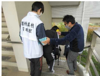
高齢者疑似体験（膳所高校）

若い世代に介護や福祉の仕事を身近に感じ、興味や関心を持ってもらうため、事業所職員が講師となり、講義や体験を通じて、高齢者や障害者への接し方や、介護・支援の基本的な知識を伝える出前講座を実施する。