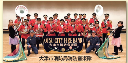
大津市消防局消防音楽隊