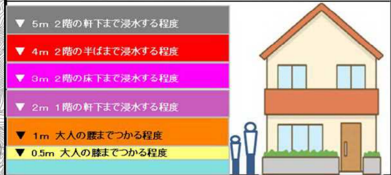
「浸水想定区域の色分け」と「浸水深の目安」