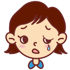
接着剤による アレルギー症状