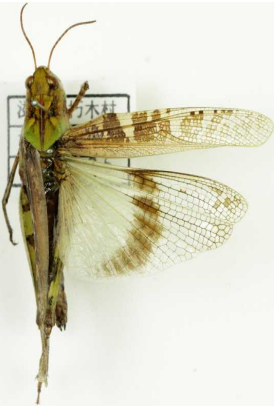
クルマバッタモドキ