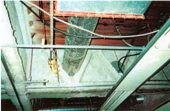
鉄骨造の梁・柱の耐火被覆