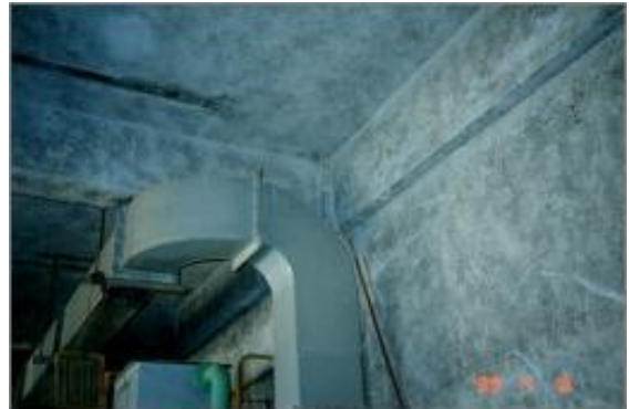
機械室の壁・天井の断熱