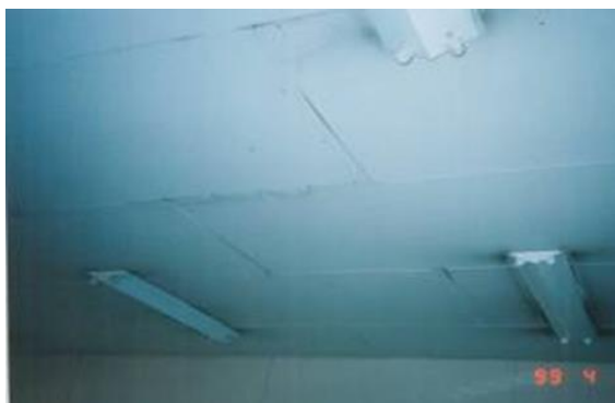
天井のスレート板

大津市環境部環境政策課 電 話：077-528-2735 FAX：077-522-1097