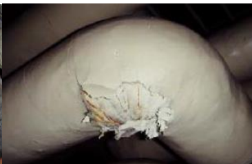
エルボ部に使用 石綿含有保温材