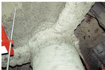
柱や梁に施工 吹付け石綿