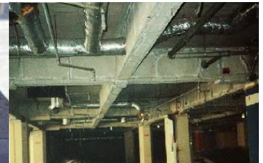
鉄骨を被覆して保護 石綿含有耐火被覆材