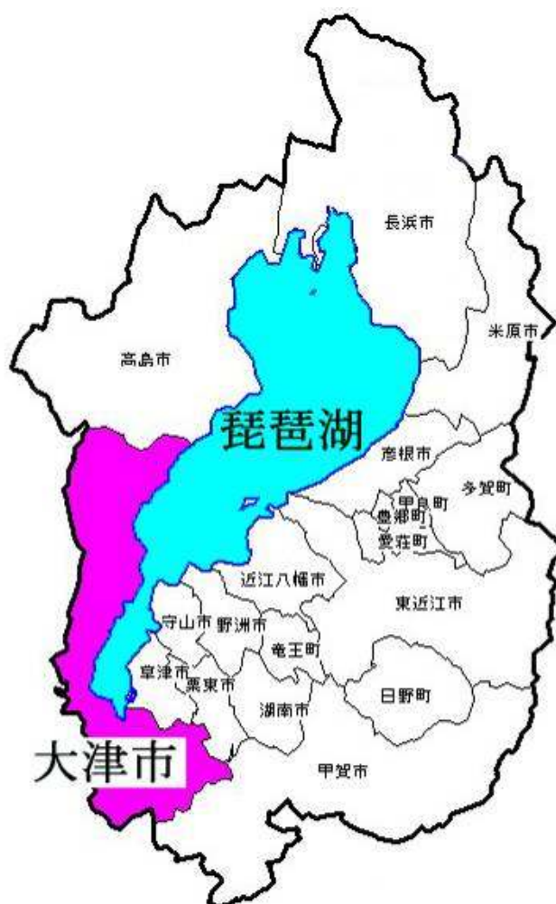
図 2-1-1 本市の位置図