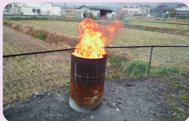
ドラム缶や一斗缶での 焼却も禁止

※公益上若しくは社会の慣習上やむを得ない廃棄物の焼却又は周辺地域の生活環境に与える影響が軽微であり、法の目的に照らして合理的と認められるものはこの限りではありません。