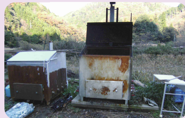
簡易な焼却炉での 焼却も禁止