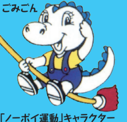
「ノボイ運動」キャラクター

集積所に出すごみ(紙ごみ以外)は、大津市指定ごみ袋に入れ、口をしっかりくくって出してください。1回の排出は45リットルサイズの袋で2袋までを目安としてください。