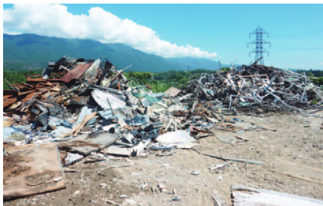
保管基準を守っていない例