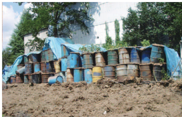
廃棄物等放置の例