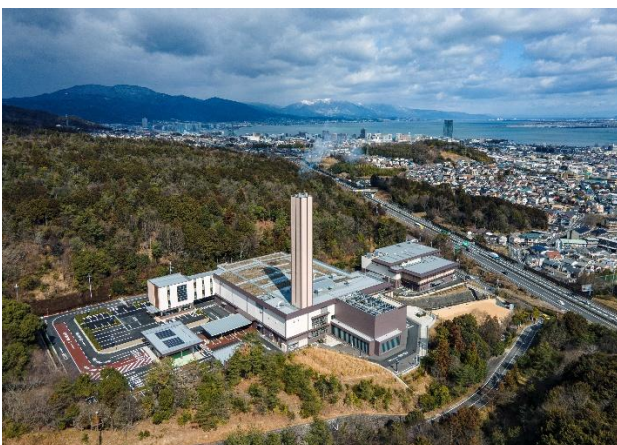
環境美化センターの整備 (令和 3 年 7 月供用開始)