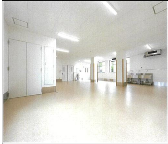
中学校の配膳室等の整備 (令和 2 年 1 月供用開始)