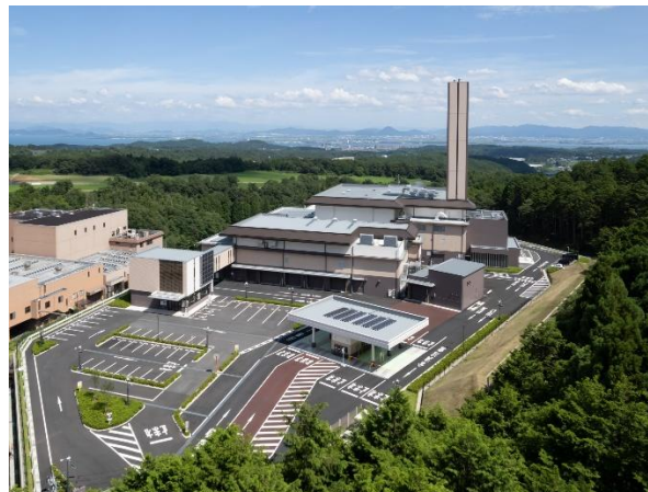
北部クリーンセンターの整備 (令和 4 年 7 月供用開始)