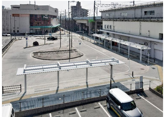
JR 和邇駅周辺の整備 (平成 31 年 3 月供用開始)