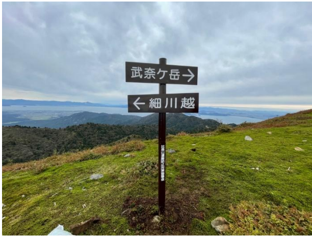
比良里山散策道のルート整備 (道標・案内看板の整備)