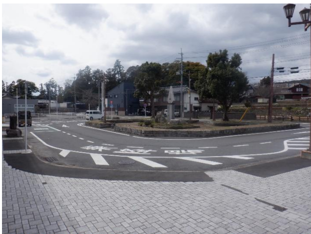
JR 駅前広場の整備 (JR 蓬萊駅前広場整備:令和 7 年 3 月供用開始)