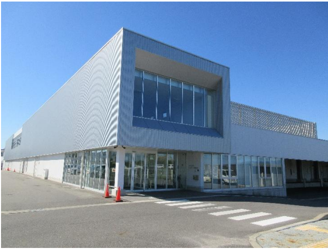
東部学校給食共同調理場の整備 (令和 2 年 1 月供用開始)