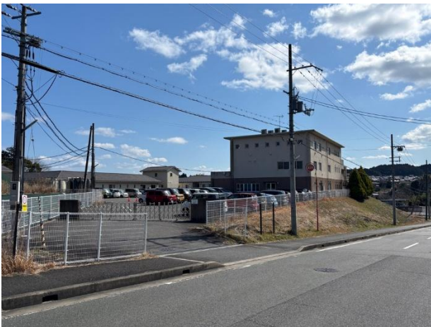
北部知的障害者複合施設の整備 (平成 22 年 4 月供用開始)