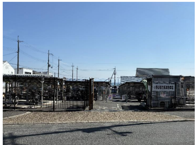
JR 小野駅前自転車駐車場の整備 (平成 26 年 4 月供用開始)