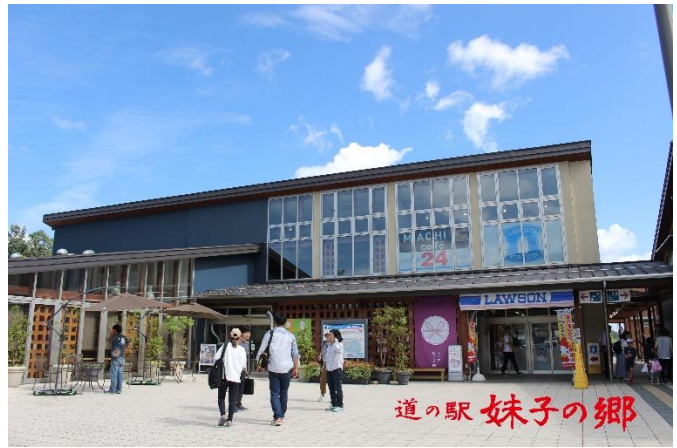
道の駅 妹子の郷の整備 (平成 27 年 8 月供用開始)