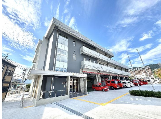
中消防署の整備 (令和 6 年 11 月供用開始)