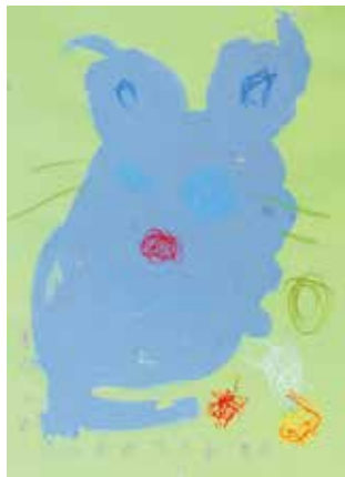
田上幼稚園 3歳児 廣瀬 凌空 「ねずみくんだいこうぶついただきます」