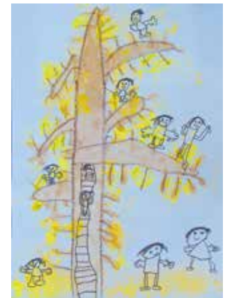
瀬田幼稚園 5歳児 信友 隼人 「いちょうのきであそんでいるよ」