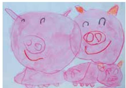
仰木の里幼稚園 4歳児 田中 青葉 「3びきのこぶた」