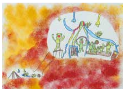
志賀南幼稚園 5歳児 河面 凧 「なかよしのかえる」