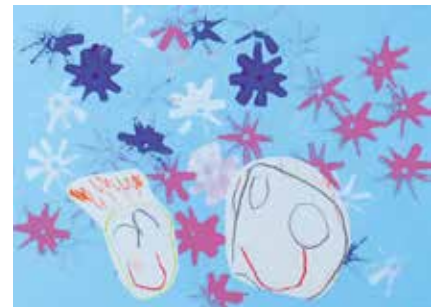
上田上幼稚園 3歳児 安井 理登 「おともだちとコスモス畑にいったよ」