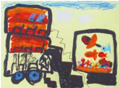
晴嵐幼稚園 5歳児 西浦 実玖 「おともだちいっしょに3かいだてのぼすにのってすいそくかんへしゅっぱつ!」