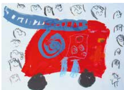
上田上幼稚園 4歳児 笹川奈々花 「みんなで大きな消防車を見たよ」