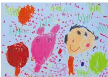
おおがや愛保育園 4歳児 平岡 亜心 「みんな一緒」