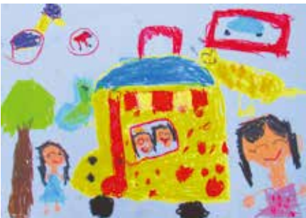
永興藤尾こども園 5歳児 堀 咲 「ジェラートやさんがやってきた!」