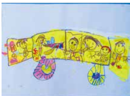
長等幼稚園 4歳児 重 佳汰 「みんなでの楽しいバスえんそく」