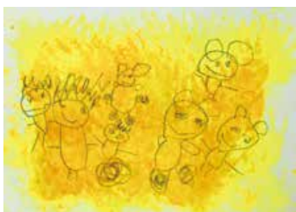
青山幼稚園 4歳児 藪野 洸人 「あきのもりでいっしょにあそぼう」