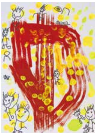
比叡平幼稚園 4歳児 倉橋 尚希 「おおきなイチヨウの木であそんだよ」