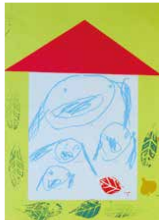
晴嵐幼稚園 3歳児 藤田 彩楓 「だいすきなかぞくみんなのおうちだよ」