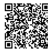
大津市がんに関する 情報サイト