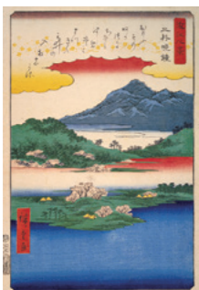
歌川広重「魚米版」 近江八景「三井晩鐘」

近江八景は、中国の景勝地である「瀟湘八景」になぞらえて、近江南部から選ばれた8つのすばらしい景色のことです。江戸時代初め、公家の近衛信尹が膳所城から見える範囲の景色を選んだとする説が有力です。屏風絵や絵画作品の題材として取り上げられ、初代歌川広重や葛飾北斎などが浮世絵として出版したことで多くの人に知られるようになりました。近江八景のうち「三井晩鐘」の浮世絵は、夕暮れに日没を告げる三井寺(園城寺)の鐘の音が遠くまで響きわたる情景を表現したものです。