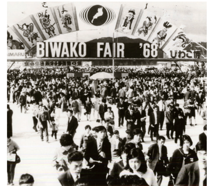
↑ 1968年のびわこ大博覧会のようす

1967（昭和42）年、大津市と瀬田町・堅田町が合併しました。この年、橋本町にあった大津市役所が、別所の現在地に竣工しました。1974（昭和49）年、国鉄（現JR）湖西線が開通し、西大津駅（2008〔平成20〕年に大津京駅に改称）が設置されました。