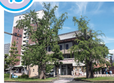
華階寺のいちょう