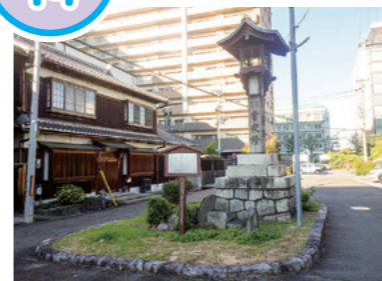
小舟入の常夜灯 (中央四丁目)