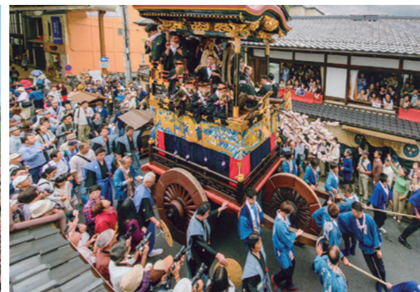
▲町内を巡行する曳山 ◀本祭当日のようす