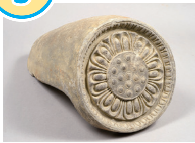
園城寺金堂付近で出土した瓦(園城寺蔵)

長等山の東側にあるこの遺跡は、今の園城寺(三井寺)が建っている場所の地下にあります。これまでに、飛鳥時代～平安時代末頃の瓦が発見されています。特に飛鳥時代の瓦は、7世紀後半の大津宮ごろに造られた穴太廃寺、崇福寺、南滋賀町廃寺、大津廃寺と似た技法や文様を使っています。このことから、園城寺の前身にあたる古代寺院があり、大津宮に關係する寺院であったと考えられています。