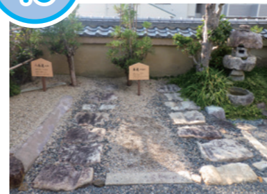
閑栖寺に復元された車石

江戸時代に大津から京都へ運ばれた荷物の中心は、琵琶湖を水運で運ばれてきた米でした。1797(寛政9)年に出版された『伊勢参宮名所図会』には、人が通る街道の脇を、牛が米俵を載せた荷車を曳く様子が描かれています。大津と京都の間では、1804(文化元)年から翌年にかけて、荷車の車輪が通る部分に車石と呼ばれる石を敷く工事が行われました。この石は、車輪の通った部分がくぼんでいます。明治時代以降の道路改良工事使われなくなった車石は、横木一丁目の閑栖寺、大谷町の逢坂関記念公園と蟬丸神社、春日町のJR大津駅前、御陵町の大津市歴史博物館などに一部が復元展示されています。