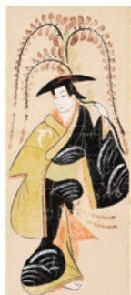
大津絵「藤娘」 (大津市歴史博物館蔵)

大津絵は、東海道五十三次の最大規模の宿場である大津宿の大谷・追分で販売され、名物として人気のあった土産物絵画でした。江戸時代前期に仏画からスタートした大津絵は、17世紀の末から風刺をきかせた鬼念仏や良縁のお守りとされる藤娘など多くのキャラクターが描かれ、街道を行き交う全国の旅人が買い求めました。江戸では歌舞伎にも登場するほどの人気があり、現代でも、様々な大津絵を市内のあちこちで見ることができます。