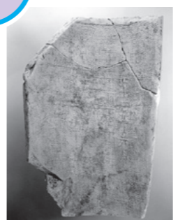
堂ノ上遺跡で出土した瓦(滋賀県産)

県立瀬田工業高等学校の北側の丘陵上にある遺跡です。発掘調査によって、奈良時代～平安時代の瓦を葺いた礎石建物や掘立柱建物が確認されました。ここで出土した瓦は近江国庁跡などで出土した瓦と同じ「飛雲文」と呼ばれる文様です。さらに「承和十一年六月」と書かれた瓦が出土し、844(承和11)年には建物があつたことがわかりました。瀬田地域には官道の東山道と東海道が通ることから、この遺跡は情報伝達のために走る馬を乗り換える場所であった古代の「駅家」の可能性があるとされています。この遺跡は国の史跡に指定されています。