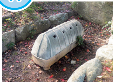
若松神社境内古墳のなかに復元された棺

若松神社境内古墳は、直径約15m、高さ約4.0mの円墳です。1966(昭和41)年に発掘調査が行われ、埋葬施設として横穴式石室をもつ古墳だとわかりました。横穴式石室は長さ約2.7m、幅約1.8mで、陶器でつくられた棺(陶棺)が安置されていました。また、金環・大刀・須恵器と一緒に添えられており、7世紀初めごろにつくられた古墳だと考えられます。出土品は滋賀県が保管しており、現地では復元された棺を見ることができます。