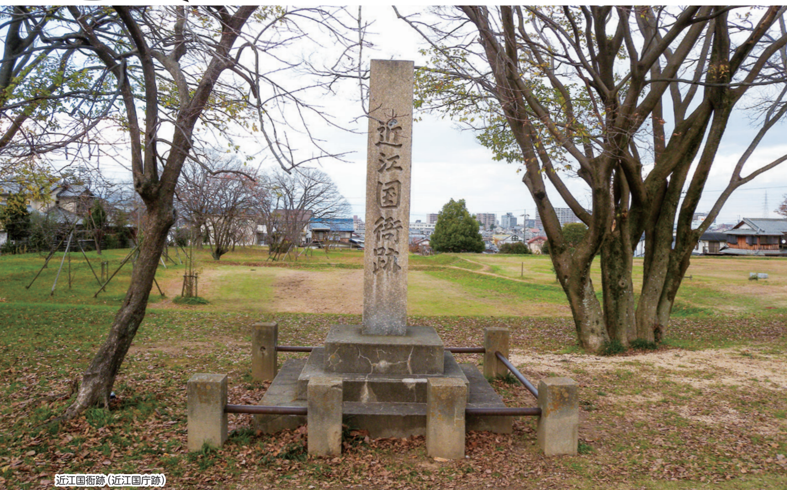
近江国衙跡(近江国庁跡)