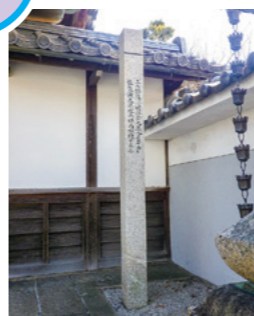
西光寺の洪水石標

1896(明治29)年9月、滋賀県各地で豪雨が続き、琵琶湖の水位が急上昇して、湖岸の地域に浸水し大きな被害をもたらしました。のちに「琵琶湖大洪水」と呼ばれる水害です。大津市内では、通常の水位から約3mも上昇した記録もあります。瀬田地域には、浸水の高さを示したのとして西光寺の石標や善念寺の石垣があります。