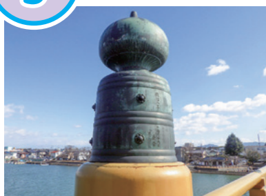
瀬田唐橋の擬宝珠

現在の瀬田唐橋の東詰から瀬田川沿いに100mほど下流に進むと、龍王宮秀郷社(橋守神社)があります。百足退治の伝説で知られる俵藤太と龍神(龍宮乙姫)をまつる2つの社と、その間に太い木材があります。これは、瀬田橋を架け替えたとき、古い橋脚を伐ってまつったものです。また、架け替えが終わると、橋の古い材木を使って木像が彫られ、関係者に配られました。架け替えによって橋の欄干の擬宝珠(柱の上の玉ねぎ型の飾り)が新しくなると、そこには架け替えの年や関係した人の名前が彫られます。今に残る擬宝珠のなかには、江戸時代の膳所藩主の名前を刻んだものもみられます。