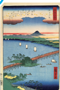
歌川広重「魚米板」 近江八景「瀬田夕照」

近江八景は、中国の景勝地である「瀟湘八景」になぞらえて、近江南部からえらばれた8つのすばらしい景色のことです。江戸時代初めごろに公家の近衛信尹が膳所城から見える範囲で選んだとする説が有力となっています。近江八景は、屏風絵や絵画作品の画題として取り上げられ、初代歌川広重や葛飾北斎などが浮世絵として出版したことによって多くの人に知られるようになりました。近江八景のうち「瀬田夕照」を描いた浮世絵は、夕焼けが照らし出す湖岸の風景だけでなく、瀬田橋や行き交う人々や船の様子を表しています。