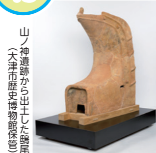
山ノ神遺跡から出土した鴟尾 (大津市歴史博物館保管)

飛鳥時代の瀬田丘陵は、須恵器(窯で焼いた硬質の土器)や鉄の一大生産地でした。山ノ神遺跡では、これまでの発掘調査で、須恵器等を焼いた窯跡4基と、工房の跡と考えられる掘立柱建物6棟が見つかりました。窯跡の1つからは、多くの須恵器とともに鴟尾(古代寺院の屋根飾り)が4基見つかり、古代の須恵器や大型の鴟尾を生産していた場所だとわかりました。その年代から、大津宮に関わる遺跡と考えられ、古代国家を支えた重要な遺跡として評価されています。この遺跡は「瀬田丘陵生産遺跡群」の1つとして国の史跡に指定され、4基の鴟尾は重要文化財に指定されました。