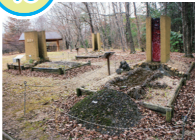
現地に復元された製鉄炉

源内峠遺跡は飛鳥時代の製鉄遺跡です。発掘調査では、4基の製鉄炉、鉄塊や鉄滓(製鉄の際に生じる不純物)といった製鉄に関連する遺物などが発見されました。なかでも製鉄炉は長さ2.0~2.5mで、この時代の製鉄炉としては最大の規模です。さらに製鉄に係る遺物は総重量で約15tもの量が出土しました。これらのことから、源内峠遺跡では鉄素材の大量生産が行われたことがわかります。この遺跡は「瀬田丘陵生産遺跡群」の1つとして、国の史跡に指定されています。