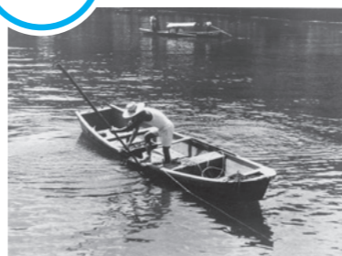
シジミ漁の様子(1957年)

もともとは琵琶湖水系にしか生息していない固有種の貝です。瀬田川周辺でたくさん捕れたことからこの名前がつけました。昔からよく食べられた食材で、縄文時代の人々が食べた貝殻が捨てられた石山貝塚でも、出土した貝の多くがセタシジミです。昭和40年代ごろまでは、岸辺にもたくさん生息し、セタシジミを使ったみそ汁やしぐれ煮、シジミ飯等は、家庭の味として古くから親しまれてきました。現在では、セタシジミの漁獲量は減少しており、稚貝の放流や漁獲量を調整して保護に努めています。