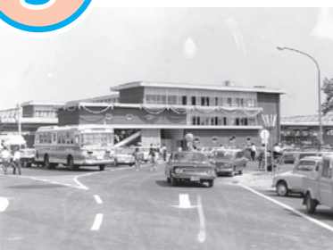
開業時の瀬田駅の様子(1969年) (大津市歴史博物館蔵)

大津市内のJR東海道線の駅のうち、最も新しい駅が瀬田駅で、1969(昭和44)年8月12日に開業しました。瀬田駅ができる前は、石山駅と草津駅の間には駅がなく、明治30年代から瀬田の人々は駅の設置を要望していました。駅は、東海道線の草津-京都間の複々線化を機会に設置されました。駅ができたことをきっかけに、周辺にはその後、びわこ文化公園(図書館や美術館)のほか、多くの住宅が建設されていきました。