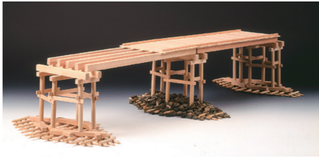
↑ 古代の瀬田橋復元模型(滋賀県立琵琶湖博物館蔵)

瀬田川にかかるただ一本の橋であった瀬田橋(瀬田唐橋)は、陸上交通の重要な場所で、下流の供御瀬とともに、しばしば戦乱の舞台となりました。672年の壬申の乱では、大海人皇子軍と近江