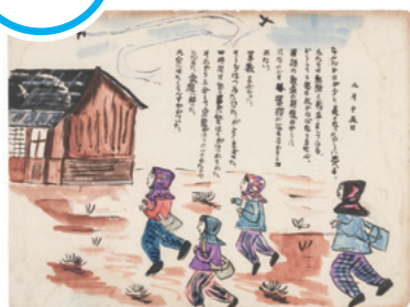
1945年2月15日の絵日記 (大津市歴史博物館蔵)

太平洋戦争の真っ只中であつた1944(昭和19)年4月から1945(昭和20)年3月までの1年間に、瀬田国民学校(今の瀬田小学校)五年智組の女子児童たちが描いた学級日記です。戦時下の学校や子どもたちの生活が、188日分にわたって記録されました。出征する兵士の見送りに行ったこと、学童疎開のために瀬田に来た大阪の子どもたちのこと、警戒警報と空襲警報が鳴るたびに避難しなければならなかったことなどが記されており、戦争の時代の瀬田の暮らしを知ることができます。この絵日記は、大津市の文化財に指定されています。