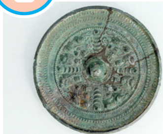
織部古墳から出土した三角縁神獣鏡 (東京国立博物館蔵)

1912(明治45)年に南大萱の織部(今の萱三丁目)で古墳が発見されました。約1700年前の古墳時代前期のもので、直径約30m、高さ3mの円墳と考えられています。この古墳からは、鉄の剣や斧の他に、邪馬台国の卑弥呼が中国の魏という国からもらったとされる三角縁神獣鏡が出土しました。同じ型で作った鏡が奈良県や京都府、岡山県などで見つっています。ただし、三角縁神獣鏡は中国では見つっていないため、日本でつくられたという意見もあります。古墳はすでに削られて残っていませんが、出土品は東京国立博物館で保管されています。