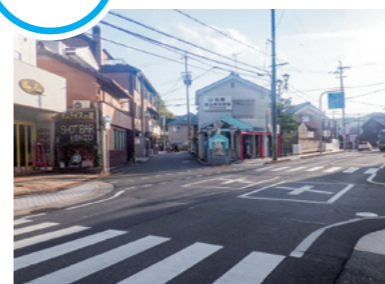
神領交差点周辺(北から)(写真左の道が東海道)

江戸時代の東海道は今も残りますが、道の幅も広くなり、新しくできた道につながるなど、大きく変わっています。それでも、昔の道の跡が残っている所があります。石山方面から瀬田唐橋を渡って250mほど進むと、神領の交差点があります。右に曲がって名神高速道路の瀬田西インターチェンジへ通じる道、そのまま建部大社へ向かう道、左ななめに国道1号に合流する道に分かれます。1895(明治28)年の地図をみると、国道1号への道はなく、建部大社方面に少し進んだ先で、左に直角に曲がる道が見えます。この道こそが、江戸時代の東海道にあたります。