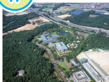
びわこ文化公園都市(1998年)

1979(昭和54)年、滋賀県は大津市と草津市にまたがる瀬田丘陵を「びわこ文化公園都市構想区域」と位置づけ、整備をはじめました。大津市では、文化・芸術・公園施設として、滋賀県立近代美術館(現滋賀県立美術館)、滋賀県立図書館、滋賀県営都市公園びわこ文化公園、スポーツ施設として滋賀県立アイスアリーナ、滋賀アリーナ、学校・教育・研究施設として滋賀医科大学、龍谷大学瀬田キャンパス、滋賀県立東大津高等学校といった施設があります。自然豊かな環境の中で、文化、スポーツに身近にふれる場所として、多くの人々に親しまれています。