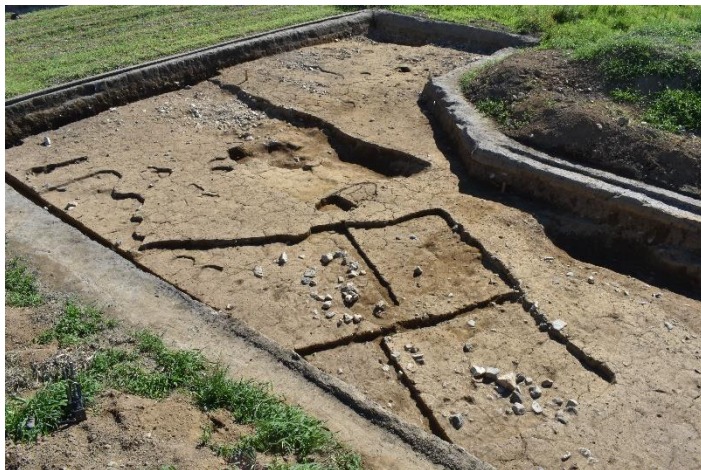
調査区南半部（北東から）