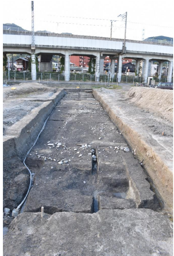
調査区全景（東から）

出土遺物としては、 すりばち や はがま ・土師器の皿などの生活用品のほかに、香炉・天目茶椀・青磁椀や金属製品など、趣味を楽しむものや仏具と思われるものなどさまざまです。さらに、道跡の東側では、木製の下駄が 4 点（2 足？）まとまって出土しました。縁側などの建物の端にあたる地点と見られ、履物を脱いだあととも考えられ、当時ここに住んでいた人々の生活を垣間見ることができます。