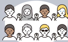
インバウンド向け対応