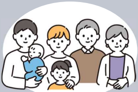
ユニバーサルデザイン化