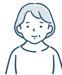
60代女性 【配達・宅配サービス利用】

移動販売のおかげで、遠くのスーパーまで行かなくても買い物ができるようになりました。自分で商品を選べるので、買い物の楽しさを感じられますし、販売員の方や利用者同士の会話も、楽しみの一つです。