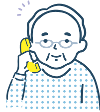
80代男性 【配達・宅配サービス利用】

お米や水などの重い物やかさばる物も、家まで持ってきてもらえるので助かっています。電話や注文書から頼めるので、スマホが苦手な私でも、簡単に利用できて嬉しいです。