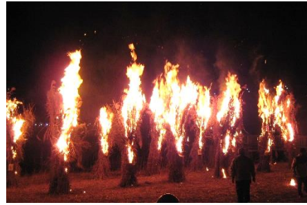
(平成29年のヨシたいまつ)